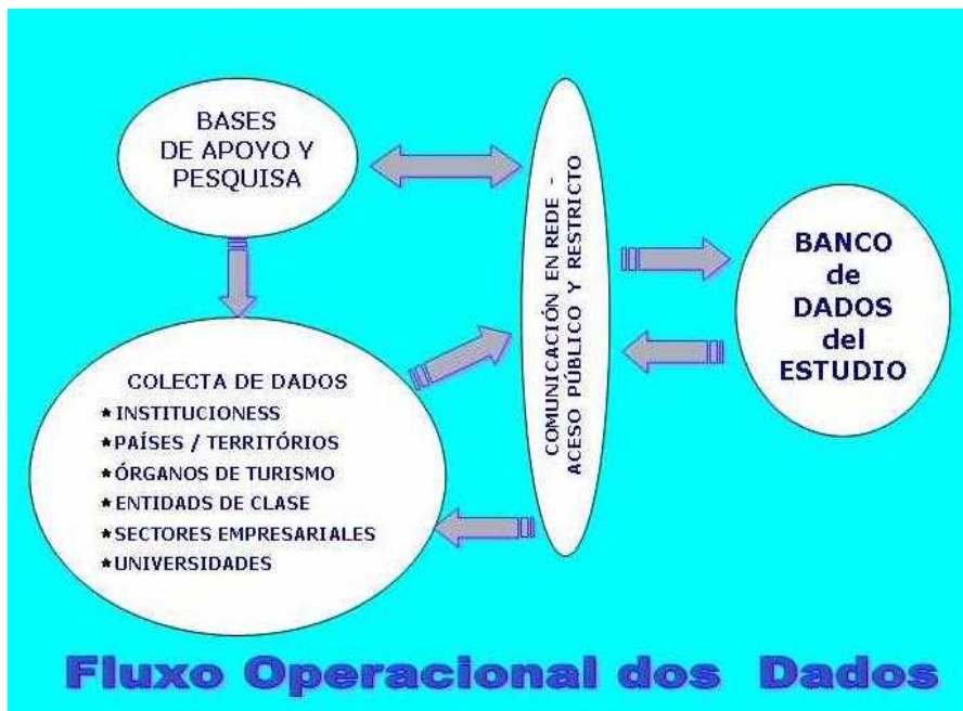
Figura 3: Flujo Operacional dos Datos